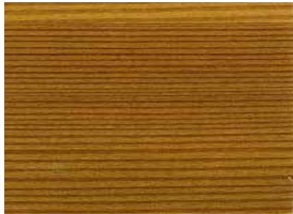
JV-Natur (auf Lärchenholz)