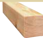
44x44mm 510cm 3,30 €/Meter