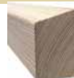
44x64/69mm 400/510cm 4,70 €/Meter