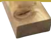
27x57mm 510cm 2,60 €/Meter