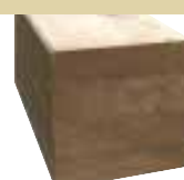
12x12cm BSH 650cm 29,00 €/Meter