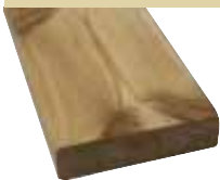
26x95mm 400cm 3,90 €/Meter