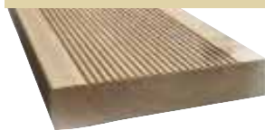
26x140mm 400/510/600cm 4,60 €/Meter