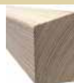
44x64/69mm 400/510cm 4,70 €/Meter