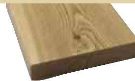
26x140mm 400, 510cm 5,20 €/Meter