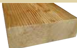
44x140mm 400cm 8,50 €/Meter