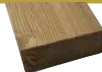
26x68mm 400cm 2,90 €/Meter