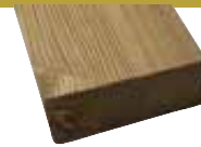
26x68mm 400, 510cm 2,90 €/Meter