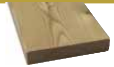
20x95mm 540cm 2,90 €/Meter