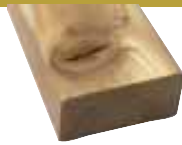
27x57mm 510cm 2,60 €/Meter