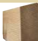
26x68mm Rhombus 300/510/600cm 2,48 €/Meter