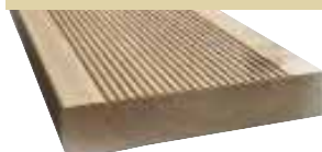
26x140mm 400/510/600cm 4,50 €/Meter