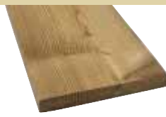
20x140mm 300, 400, 510cm 3,90 €/Meter