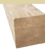
9x9cm BSH 600cm 18,00 €/Meter