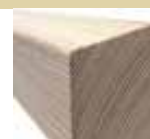
44x64/69mm 400/510cm 4,70 €/Meter