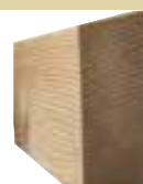
26x68mm Rhombus 300/510/600cm 2,48 €/Meter