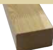
45x70mm 400/510cm 4,50 €/Meter