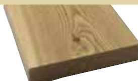
26x140mm 400, 510cm 5,20 €/Meter