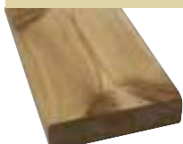
26x95mm 400cm 3,90 €/Meter