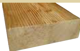
44x140mm 510cm 8,90 €/Meter