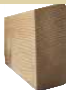
26x68mm Rhombus 300/400/510cm Länge 600cm, ab 50 Stück prodzierbar, wir bitten bei Bedarf der 600cm um Ihre Anfrage. 2,54 €/Meter