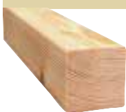
44x44mm 510cm 3,30 €/Meter