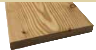
26x190mm 510, 600cm 8,50 €/Meter