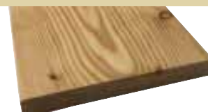
26x190mm 510, 600cm 8,50 €/Meter