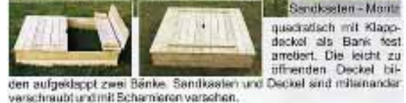
Sandkasten - Montage quadratisch mit Klappdeckel als Bank fest angeleitet. Die leicht zu öffnenden Deckel bilden verschraubt und mit Scharnieren versehen.